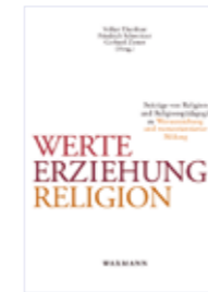
Volker Elsenbast, Friedrich Schweitzer, Gerhard Ziener (Hg.)

Die Feministische Theologie – anfangs von vielen belächelt, bekämpft oder schlicht ignoriert – hat in den letzten Jahrzehnten an Einfluss und vor allem auch Prestige gewonnen. Der vorliegende Band, herausgegeben und geschrieben von Frauen, die Einblicke in die Institutionen und Einrichtungen haben, in denen feministisch-theologisch gearbeitet wird, zieht eine Bilanz. Zusammengetragen werden attraktive Ergebnisse – eben Erfolgsmodelle – der Institutionalisierung Feministischer Theologie aus freien Initiativen, Kirchen, Universitäten, Ökumene und im interreligiösen Dialog. Damit wird einerseits auf die Erträge feministisch-theologischer Bildung und Forschung aufmerksam gemacht, andererseits aber auch ein kritischer Blick auf aktuelle Entwicklungen geworfen.