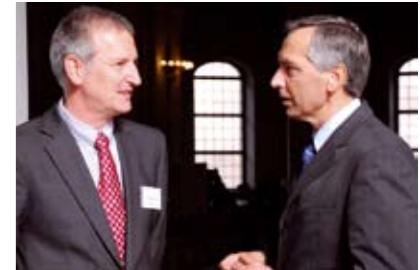
Peter Schreiner und EU-Kommissar Ján Figel' im September 2008 in Berlin

Dialog zukommen zu lassen. Citizenship-Education sei eine der zentralen Aufgaben der kommenden Jahre.